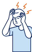
Maux de tête