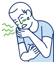
Vertiges / Nausées