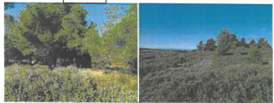
Secteur avec plus d'éléments arborés et de la garrigue à Chêne kermès