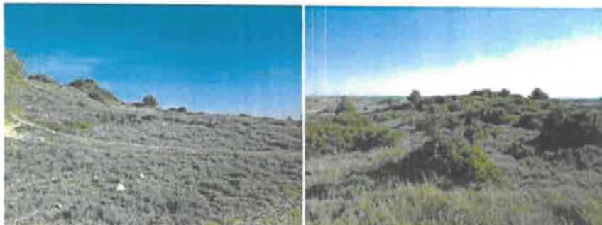
Pelouse à Brachypode rameux (à gauche) et mosaïque de pelouses et de garigues (à droite) – CBE, 2022

Lespignan Envoyé en préfecture le 14/05/2024 Reçu en préfecture le 14/05/2024 Publié le 17 MAI 2024 ID : 034-213401359-20240506-D2024_05_06_01-DE