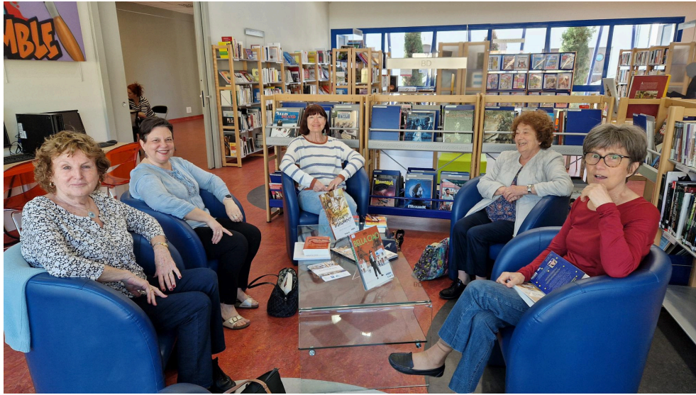
Les mots bleus, rendez-vous mensuel