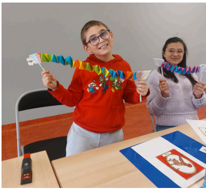
Atelier Nouvel An chinois, janvier 2024